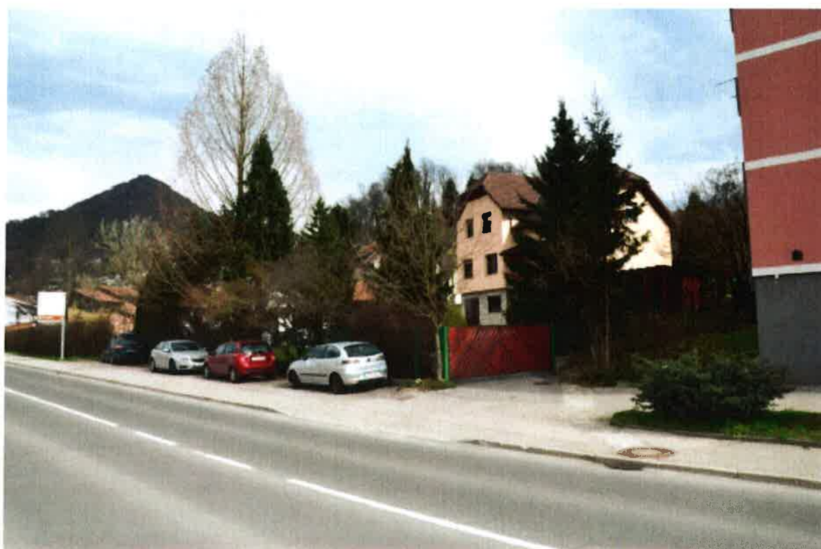
Fotografija 3: Območje PHO-3, stavbe Dom in vrt 35/36/44