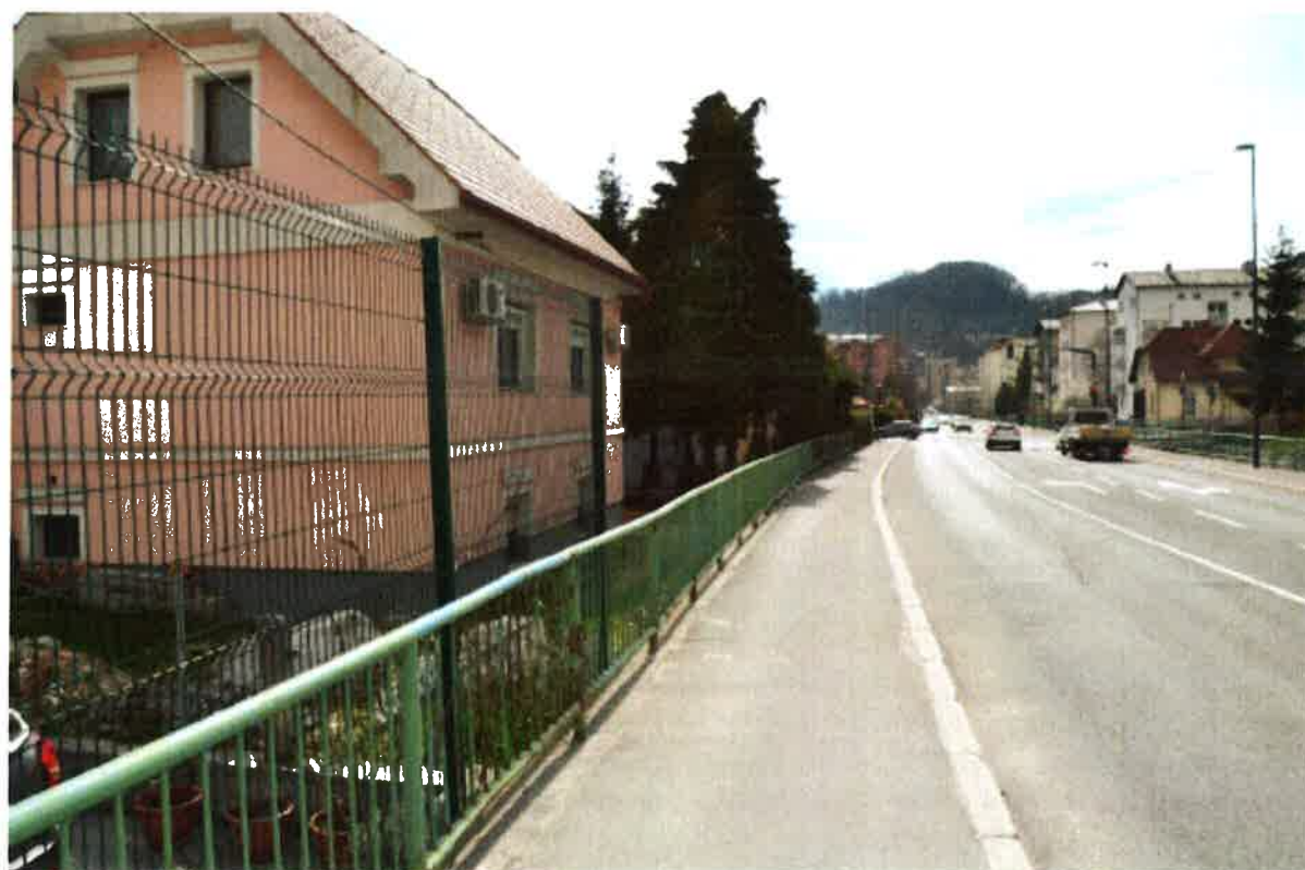
Fotografija 4: Območje PHO-4, stavbe Dom in vrt 3-13