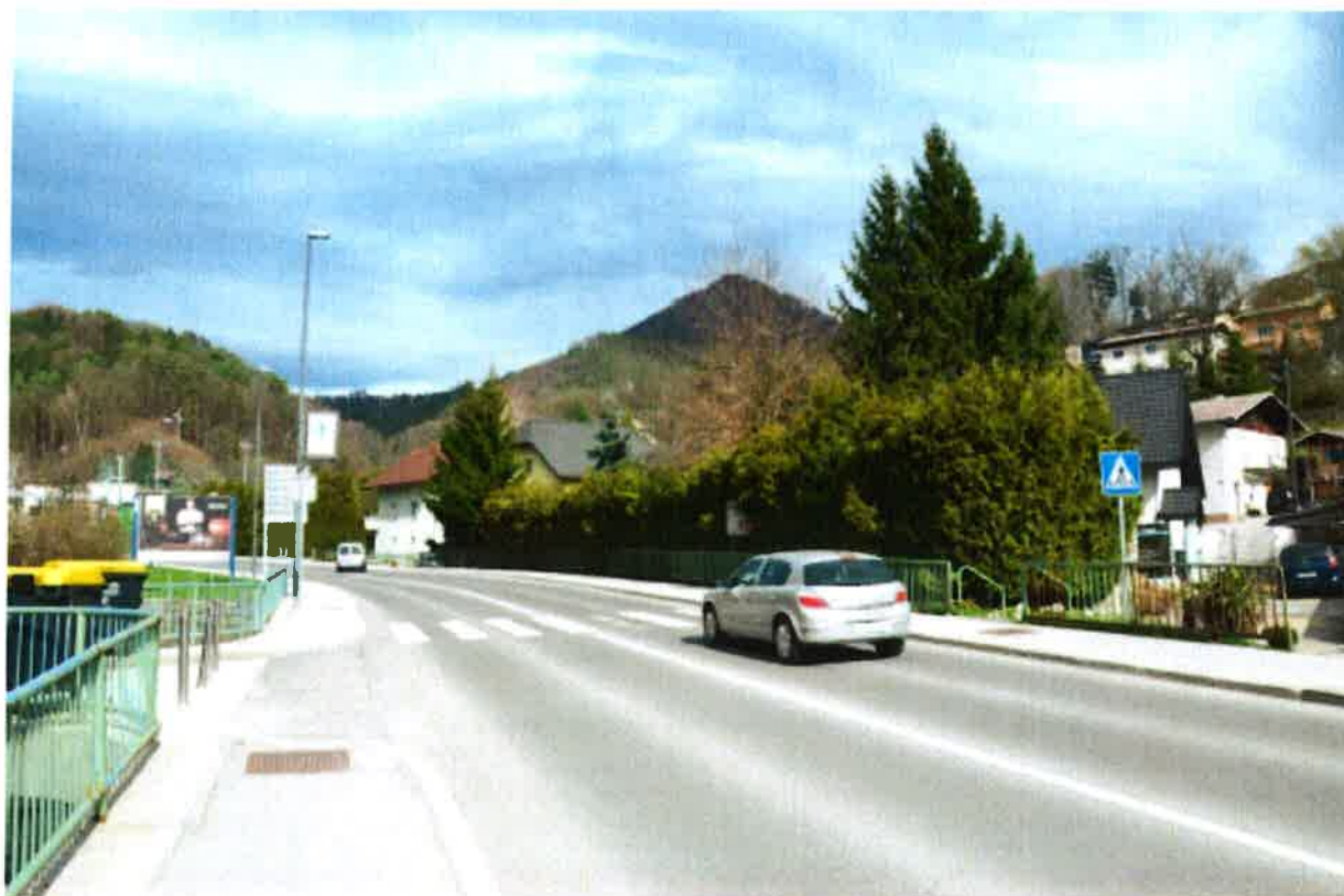
Fotografija 5: Območje PHO-5, stavbi Dom in vrt 14/16