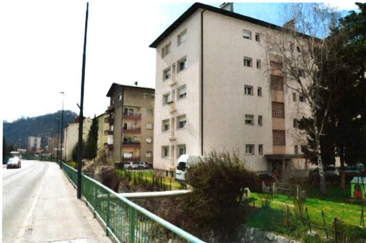
Fotografija 2: Območje PHO-2, večstanovanjske stavbe Kešetovo

Lokacije predlaganih protihrupnih ograj (Epi Spektrum d. o. o., 2017-053/PHZ, junij 2018, dopolnitev po recenziji avgust 2018)