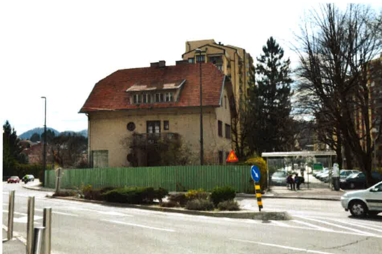
Fotografija 6: Območje PHO-6, stavba Ul. Sallamines 7